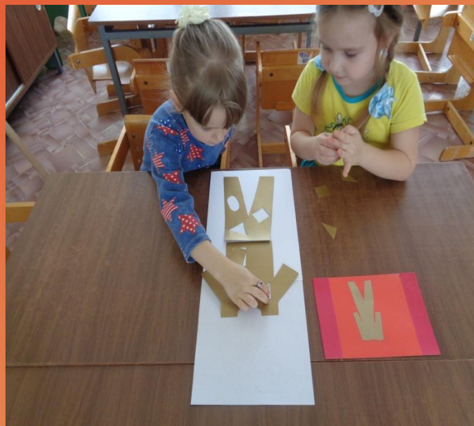
Игра «Собери картинку»