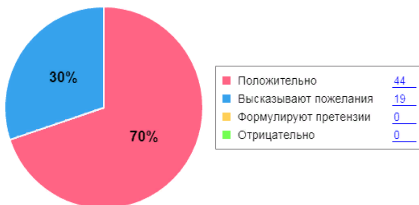
Как родители оценивают детский сад

В целом можно отметить, что процент удовлетворенности деятельностью МДОУ Детский сад № 2 составляет 97 % опрошенных родителей, что позволяет сделать следующий вывод: созданная система работы МДОУ позволяет максимально удовлетворять потребность и запросы родителей.